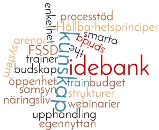
Figur 3 Nyckelord för lösningar/åtgärder (C) i förhållande till målbilden (A)

Onsdag morgon 13 april inleddes med en repetition genom att Lisa gjorde en presentation av den strategiska modellen för hållbarhet (som forskningsprojektet arbetar med). Presentationen gjordes i syfte att få feedback för att kunna bidra till att förbättra sättet modellen presenteras på, så att det på ett så bra sätt som möjligt både underlättar förståelsen och inspirerar målgrupper till att jobba med hållbarhet. Resultatet av enkäten som efterföljde presentationen ges inte i den här dokumentationen men kommer att ligga till grund för fortsatt arbete med forskningsprojektet och så småningom utmytna i konkret guidning för hur FSSD och den strategiska modellen kan presenteras i den egna kommunen/landstinget/regionen. Stort tack till alla som bidrog med feedback.