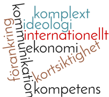
Figur 1 Nyckelord för hinder/svårigheter/svagheter (B) i förhållande till målbilden (A)

Tisdagseftermiddagen fortlöpte med diskussioner kring borden och avslutades med en gemensam dialog där de som ville fick möjlighet att sammanfatta sina samtal. Det allmänt rådande läget runt borden var att fokus för samtalen hade varit på nuläget (B) och möjliga lösningar (C). Lisa samlade in alla lappar för en övergripande sammanställning som utgångspunkt för fortsatta samtal under onsdagen. Bilderna nedan är en sammanställning av ett axplock från samtalsgrupperna.