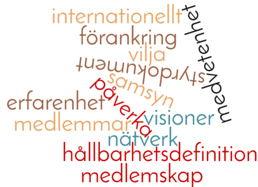
Figur 2 Nyckelord för möjligheter/styrkor (B) i förhållande till målbilden (A)